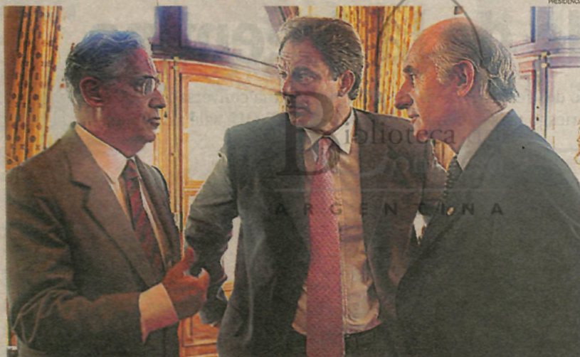
EVALUACION TENSA. El presidente De la Rúa, ayer en Foz de Iguazú, junto al brasileño Cardoso y al británico Tony Blair.

Siguiendo el consejo de su hermano Jebb, el presidente de EE.UU. llamó a De la Rúa para decirle que el FMI adelantará dinero • También Blair respaldó esa iniciativa • Por eso, un funcionario del Tesoro vendrá a Buenos Aires