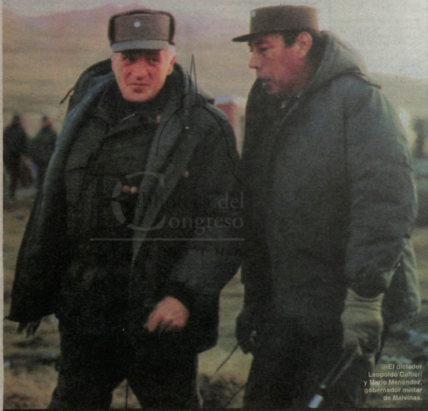
El dictador Leopoldo Galtieri y Mario Menéndez, gobernador militar de Malvinas.