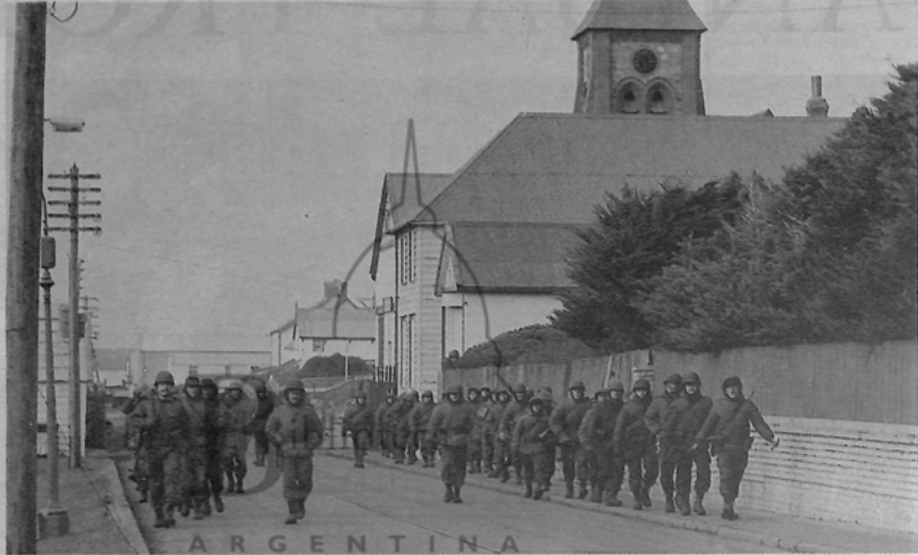
El 3 de abril de 1982, al día siguiente del desembarco, tropas argentinas desfilan por la avenida Ross de Port Stanley, capital de las Islas.

Murieron después de la última batalla casi tantos como en combate, y casi el mismo número de los muertos por el hundimiento del "Belgrano". Retrato de los ex combatientes en una guerra que, imaginada desde el régimen militar para ganar apoyo popular y eternidad, fue una gran aventura.