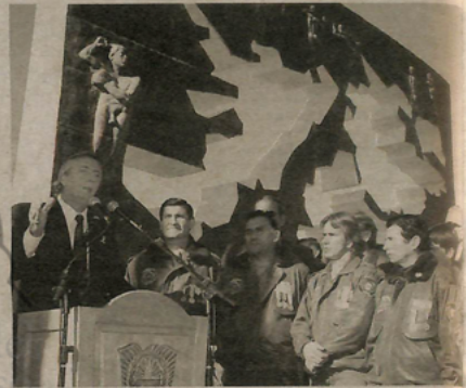
El presidente Kirchner junto a los veteranos de Malvinas. "Las Malvinas serán argentinas por el diálogo", dijo Kirchner.

El presidente Néstor Kirchner encabezó el acto central en homenaje a los veteranos de la Guerra de Malvinas.