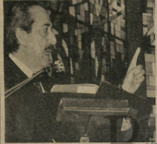
Atipico lugar eligió ayer el Presidente para dar, él también, un sermón. Fue en la Iglesia Stella Maris.

AFICHES La izquierda local, que ya expresó su opinión sobre la visita del Papa a través de una revista presuntamente intelectual, parece dispuesta a empujar buena parte de la ciudad con afiches que muestran a Su Santidad dando la bendición a ex funcionarios de la administración militar. Como si el mismo hubiera convalidado el proceso. Una campaña insidiosa, obvia, espejo final de una política decadente, impregnada de resentimiento.