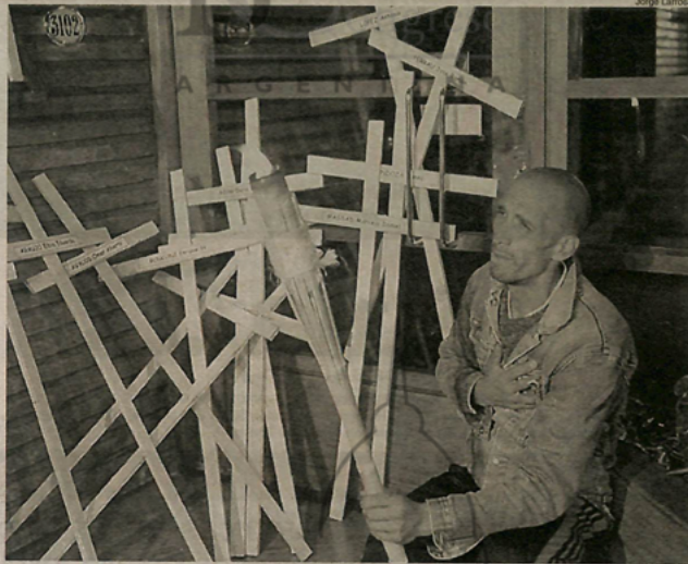
Las cruces fueron depositadas en la puerta de calle de la lujosa casa de departamentos. Queda en Chivilcoy y Tinogasta. Ahí hace vida normal Galtieri, quien no se priva de ir a misa y comulgar.